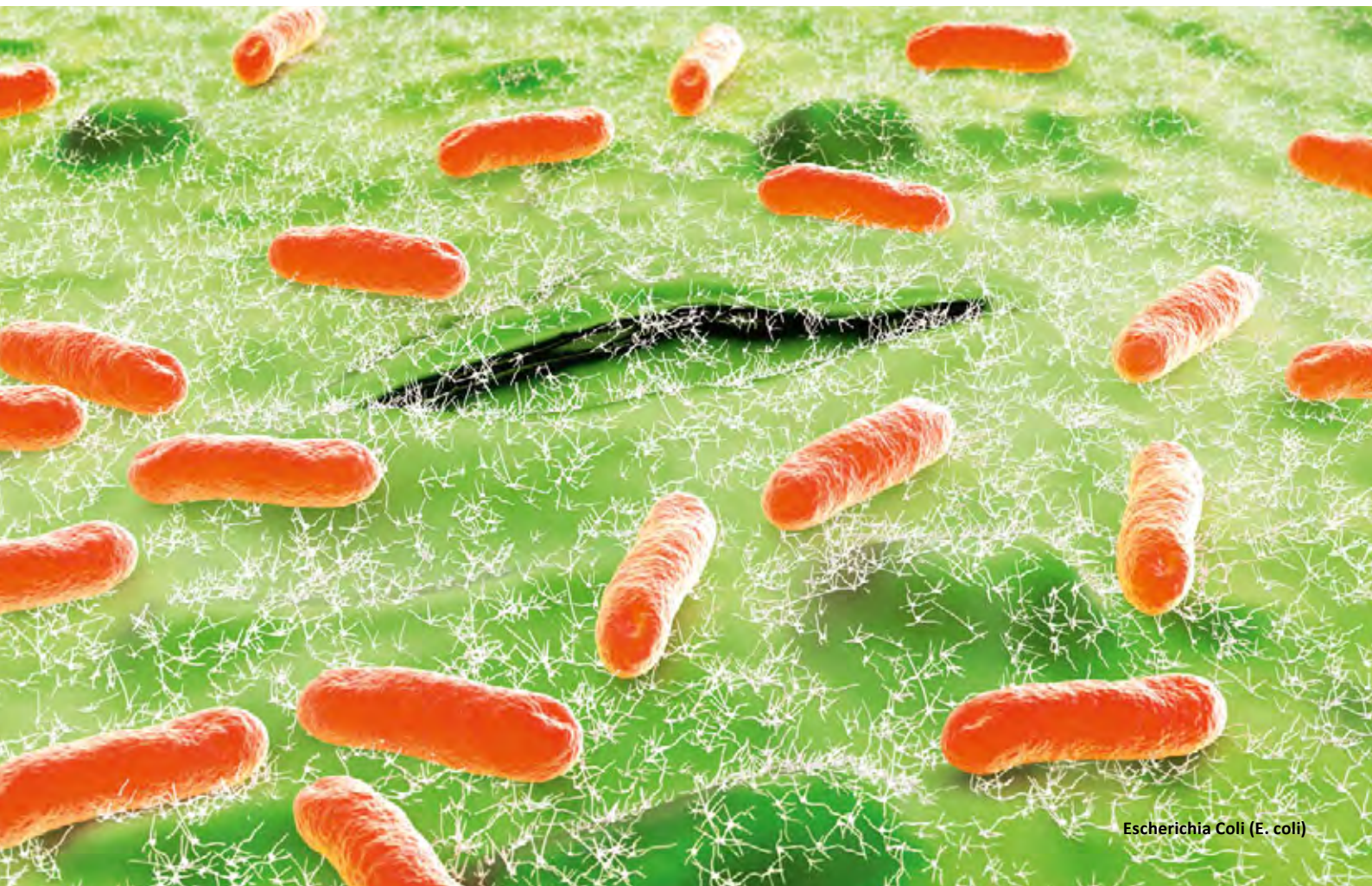
Escherichia Coli (E. coli)